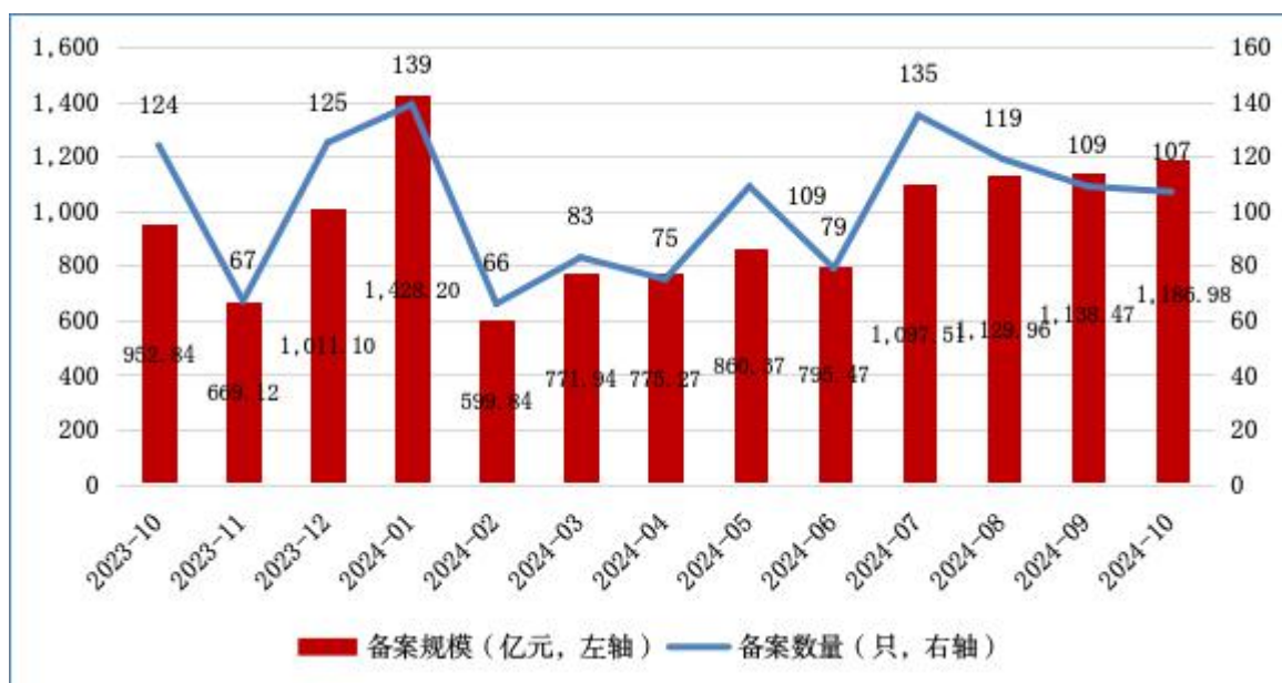
图1 ABS月度备案数量及规模情况

2024年10月，资产支持专项计划 [1] （以下简称ABS）新增备案107只，新增备案规模合计1,186.98亿元（见图1）。其中基础设施公募REITs所投ABS [2] 备案5只、108.98亿元。此外，新增备案规模前三的ABS基础资产分别为：不动产持有型ABS、小额贷款债权、应收账款，备案规模分别为318.80亿元、257.02亿元、234.83亿元（见表1）。