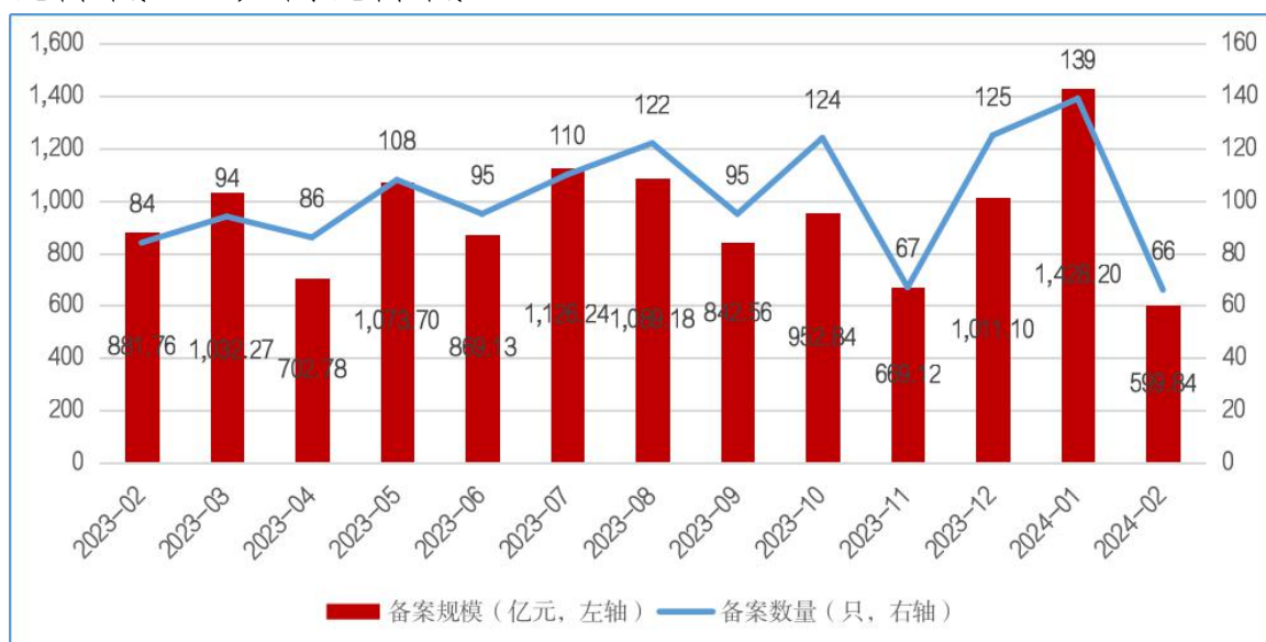
图1 ABS产品每月备案规模及数量变化趋势

2024年2月，企业资产证券化产品共备案确认66只，新增备案规模合计599.84亿元（见图1）。2月新增备案规模环比降低58%，同比降低32%。