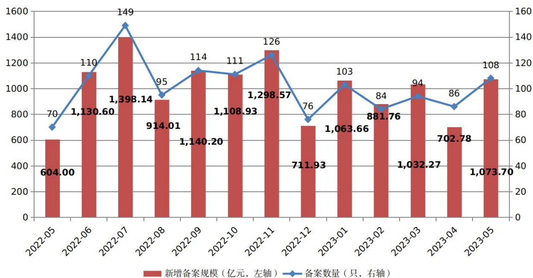
图1 ABS产品每月备案规模及数量变化趋势

2023年5月，企业资产证券化产品共备案确认108只，新增备案规模合计1,073.70亿元（见图1）。5月新增备案规模环比增长52.78%，同比增长77.76%。